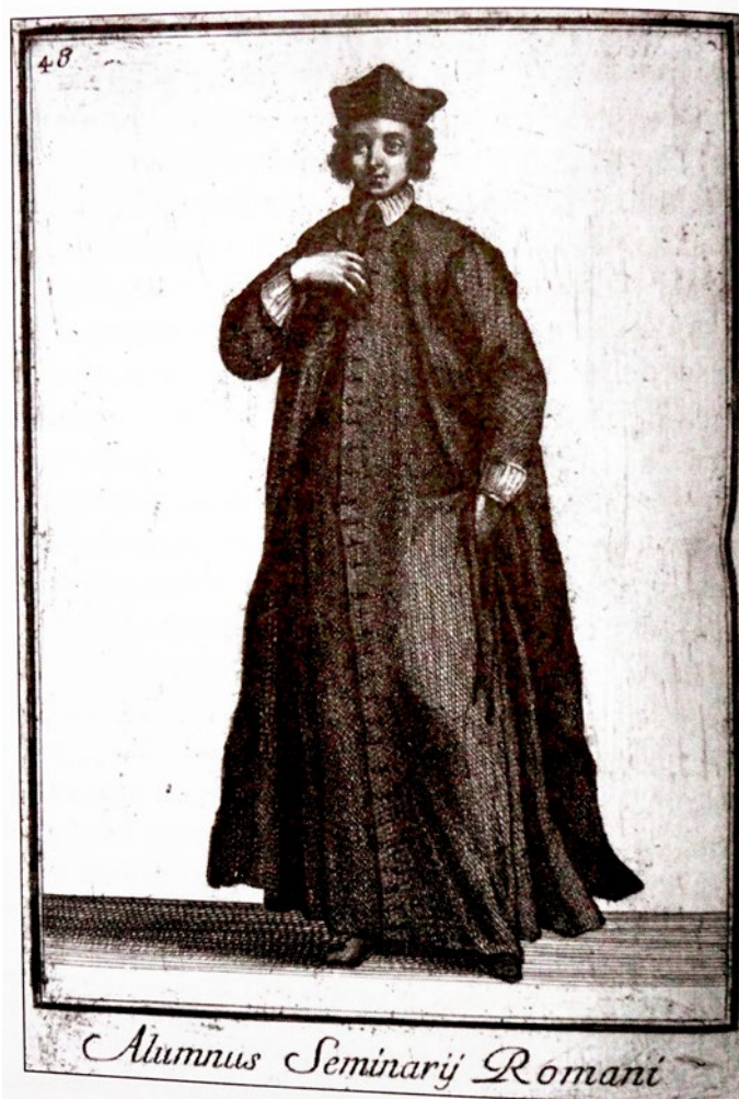
Ilustrace alumna římského semináře z Říma od Arnolda van Westeroutha.

V pondělí 14. dubna 1636 se v 7 hodin ráno konala promoce. V univerzitní aule (což je doposud používaný název reprezentativní místnosti univerzity) se shromáždilo 45 důstojných, velkorysých, ušlechtilých a erudovaných (tj. těch, kteří studovali a nahromadili znalosti z knih) pánů kandidátů. Mezi nimi byl přítomný „Martinus Banoczy, Moravus, Banoviensis“. Za přítomnosti promotora (univerzitního profesora vedoucího promoci), se latinsky vedla slavnostní disputace kandidátů na zadané filozofické a matematické téma. Taktéž od něj přijali „první vavříň svobodných umění a filozofie“, nám dnes známý jako titul bakalář. (V překladu z latiny bacca-laureus = první / nižší vavříňový věnec.)