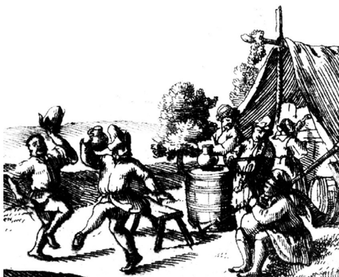
Tanec ve vojenském tureckém táboře při džbánu dobrého pití a za zvuku houslí a dud. Nejspíše stejně slavivali i olomoučtí studenti. (Výřez z mědirytiny znázorňující uherský hrad Varano / Vranov od Justuse van den Nypoort uvedená v knize Antona Ernesta Buckharda von Birckenstein z roku 1686.)

O rok později, ve dnech následujících po sváteční neděli Veliké noci (roku 1636 vycházela na 23. března) se Olomoucí šířily tzv. univerzitní teze. Jednalo se o tištěnou pozvánku plakátového rozměru, s obrázkem a textem, sloužící k oznámení konání slavnostní disputace (jedná se o diskuzi podle daných pravidel), která byla součástí veřejné promoce uzavírající studium. Včetně uvedení disputačních témat. (Můžeme říct, že se jednalo se o předchůdce dnešního promočního oznámení.)