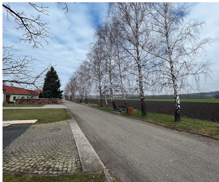
Močír po přorezáni bříz