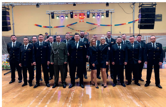
Členové jednotky při zahájení hasičských šibřinek

Pokud jde o technické vybavení a věcné prostředky, lze neskromně uvést, že je na výborné úrovni. Kromě odpovídajících ochranných pomůcek hasičů a moderní zásahové techniky za zmínku stojí pře-