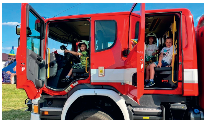
Dětský den na Páleníci