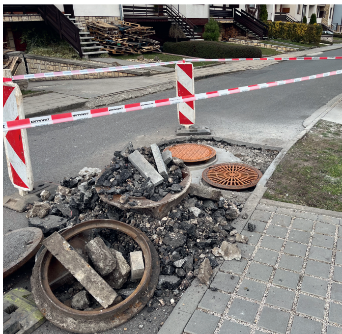
Rekonstrukce vpusť a šachet na obecních komunikacích

V souvislosti s parkováním musím opět požádat řidiče, aby neparovali auta na chodnicích ani na silnici. Musíme na to opět jednotlivce upozornit a případně se obrátit na policii.