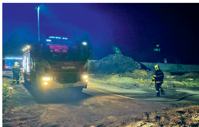
Požár 22. 3. 2022, Bánov

Základním posláním jednotky sboru dobrovolných hasičů obce je pomoc při požárech, živelných pohromách a jiných mimořádných událostech. Jak již bylo naznačeno v úvodu, v minulém roce jsme zaznamenali podstatný nárůst výjezdů. V roce 2022 jsme vyjžděli celkem k 18 událostem (+7 oproti roku 2021). Z toho bylo 13 požárů (+5), 2 technické pomoci (-1) a 3 pátrání po pohřešované osobě (+3). Na území obce Bánov jsme řešili 3 mimořádné události (-2). Samostatně jednotka zasahovala ve 2 případech (+1).