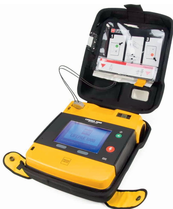
AED ve výbavě jednotky