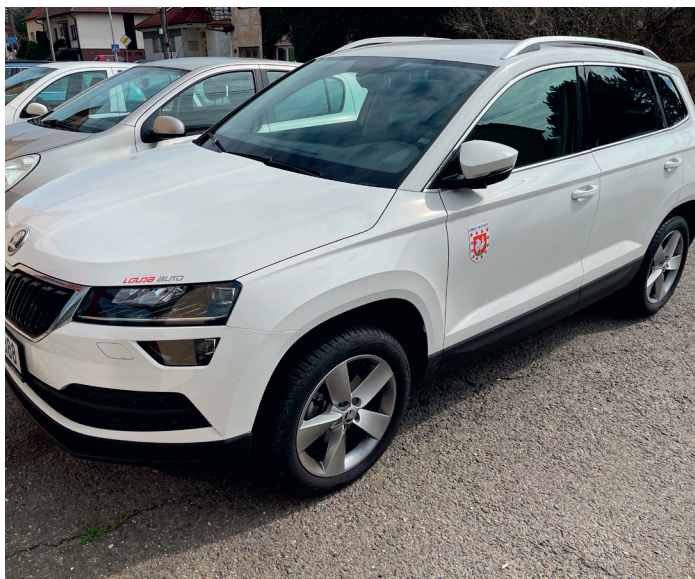
Nový obecní vůz Škoda Karoq

V druhé polovině dubna začne i úprava předprostoru zdravotního střediska. Zde počítáme s tím, že bude zcela dostatečné parkoviště u sportovní haly a příchod od haly do budovy střediska a lékárny bude vždy zajištěn. Silnice před střediskem tak bude moci být po dobu výstavby podélných parkovacích míst zcela uzavřena. Chtěl bych také upozornit, že před bytovým domem naproti lékárny vzniklo nové parkoviště, které si však vybudovali vlastníci bytů na své náklady a jedná se tedy o jejich soukromá parkovací místa. Prosim tedy všechny návštěvníky střediska, aby neblokovali tato parkovací místa podélným stáním před parkovacími místy na silnici. Je to proti předpisům, a je to především bezohledné. Z parkoviště u haly přijde ke středisku každý. Například v Uherském Brodě na poliklinice nachodí pacient jen v budově mnohem delší vzdálenosti než od haly ke středisku. A v nemocnici v UH taktéž. Zároveň ale žádám i obyvatele bytového domu, aby byli shovívaví k parkujícím, jelikož situace je po mnoha letech nová a někteří řidiči se tak rychle neorientují.