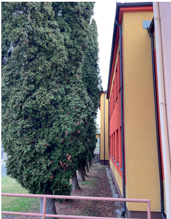
Túje u ZŠ