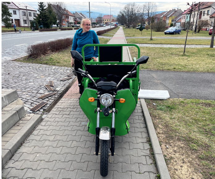
Nová elektrická komunální tříkolka