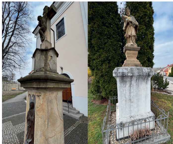
Památky před rekonstrukcí

šení. Podél fasády do ulice se musí vykopat jedna větev kanalizace a je jisté, že budou narušeny kořeny tují podél školní tělocvičny. Túje jsou navíc již přerostlé a nasazené příliš blízko budovy, což neprospívá ani fasádě, ani základům. Tyto túje tedy budou muset být pokáceny. To je pro mě na celé věci asi nejnepříjemnější záležitost. Nicméně po zvážení všech aspektů je to jediné řešení. Vzrostlá kryptomerie u schodiště našťastí může zůstat na svém místě, takže tam největší strom zůstane. Na travnatém pásu před tújemi vysadíme nové stromy.