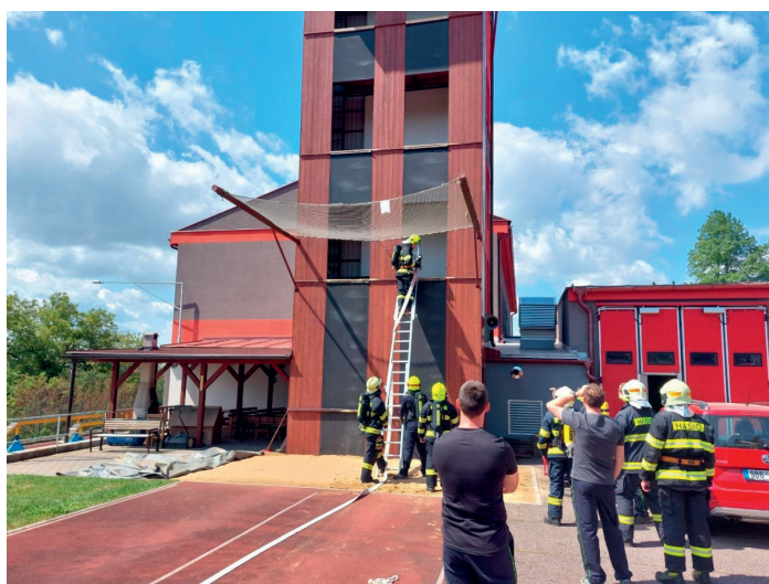
Součinnostní výcvik, 21. 5. 2022, stanice Uherský Brod