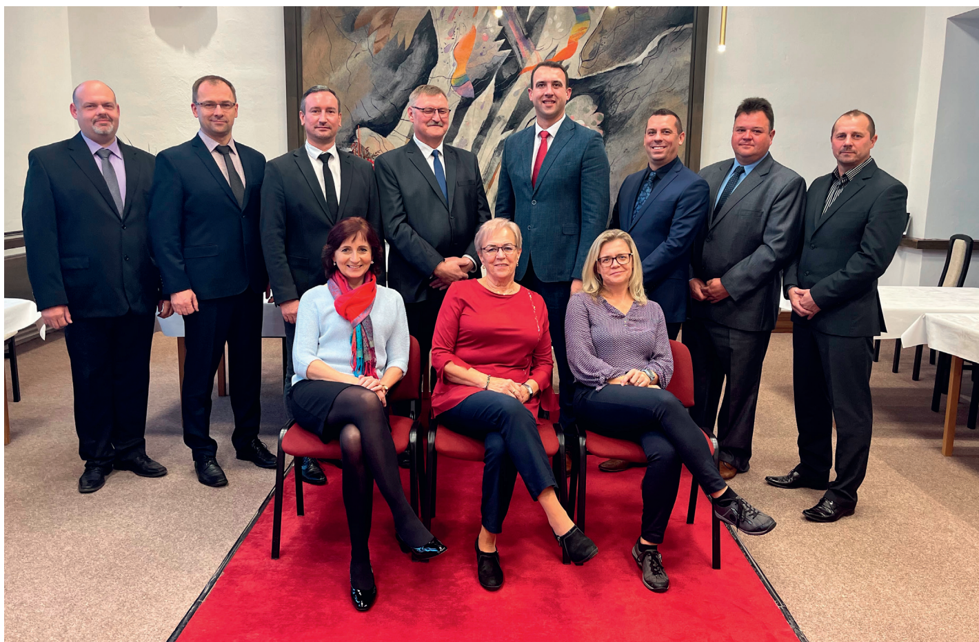
Zastupitelstvo obce Bánov

V pátek a v sobotu 24. - 25. února 2023 se ve Sportovní hale uskuteční jubilejní