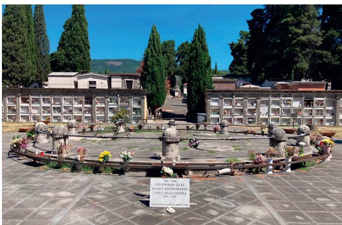
Celkový pohled na společný hrob rakousko-uherských zajatců.