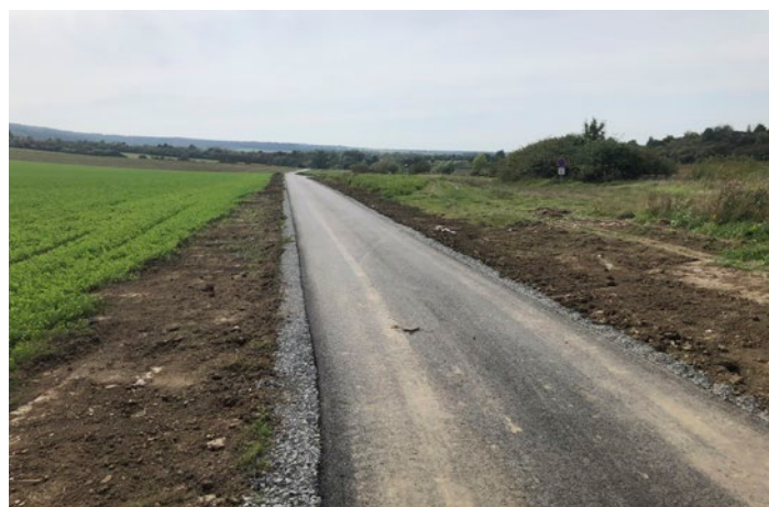
Polní cesta u Ordějova