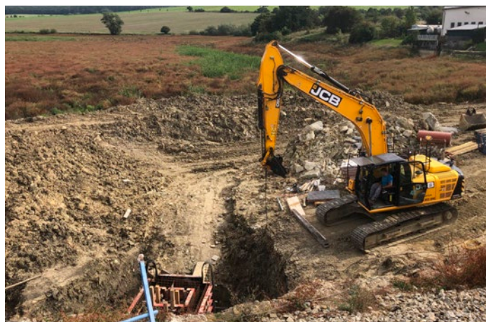
Rekonstrukce stavidla na Ordějově

Jedna z věcí, která nám už delší dobu dělá vrásky, a nejenom nám v Bánově, ale všem šesti obcím mikroregionu, jsou naše rozhledny, které se čím dál rychleji rozpadají. Tak jako v Bystřici pod Lopeníkem, jsme už byli nuceni i naši rozhlednu uzavřít. Dřevo bohužel pracuje a některé praskliny jsou takové, že stavba ztrácí statiku. Statický posudek doporučil opravu, která by přišla skoro na půl milionu korun a nezajistí trvanlivý výsledek. Všechny obce mikroregionu zvažují co dál s těmito turistickými cíli, zdali stavit nové rozhledny, jiné odpočinkové body, nebo vymyslet například