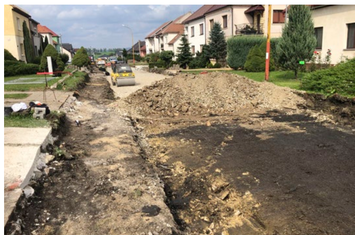
Výstavba komunikace, chodníku a osvětlení U Školy

Po tom dlouhém „kulturním půstu“ byly poslední týdny opravdu pestré, za což jsem vděčný. Nicméně jsme nezapomněli ani v obecních stavbách. Jak jste si jistě všimli, máme hotovou asfaltovou polní cestu z Močírě až k odbočce k ČOV, kolem Ordějova již je také položený asfaltový koberec a zbývající živičné povrchy od vodojemu u obchvatu až po sucholožskou skautskou chatu budou pokládány v první polovině října. V Jakubovci probíhá rekonstrukce vodovodu, kterou investují Slovácké vodárny a kanalizace. U Školy už jsou hotové podkladní vrstvy pro novou silnici a pracuje se na veřejném osvětlení a chodníku. Výběrové řízení zde vyhrála firma Skanska, za což jsem rád, jelikož se prací zhostili moc dobře a rychle. Nechci ale nic zakřiknout, to zhodnotí hlavně místní obyvatelé. Další nové veřejné osvětlení, tentokrát v nově rostoucí ulici, má již elektrické vedení v zemi a budou se umísťovat sloupky a svítidla. Silnice se zde plánuje až v příštím roce. Ona ta silnice by zřejmě při tomto stavebním pohybu na pěti stavbách rodinných domů najednou ani postavit nešla. Osvětlení jsme sem ale chtěli dát co nejdříve, především z důvodů preventivních. ➔