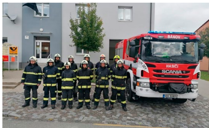
Členové naší jednotky při uctění památky zesnulých kolegů

Ve středu 15. září odpoledne nás zasáhla zpráva o úmrtí dvou dobrovolných hasičů při výbuchu plynu v rodinném domě v Koryčanech.