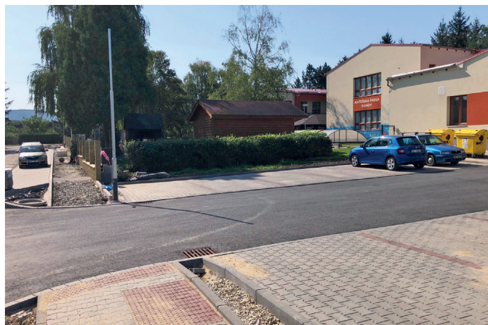
Parkoviště u mateřské školky

Hotový bude chodník a parkovací stání u mateřské školky. Zahradka školky má i nové oplocení a u chodníku jsou také nové sloupky a svítidla veřejného osvětlení. Staré sloupky budou demontovány až se starým rozhlasem, který bude nahrazen digitálním rozhlasem. Na chodník a veřejné osvětlení jsme získali dotaci od Ministerstva pro místní rozvoj ve výši 1,6 milionu Kč.