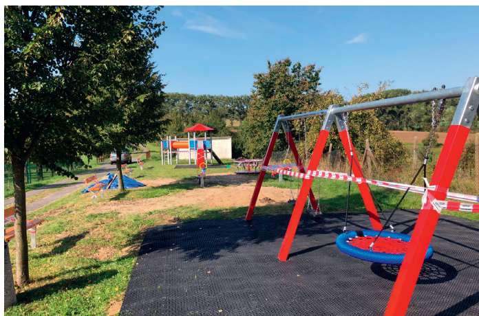
Dětské hřiště v Jakobovci

V září byly demontovány staré hrací prvky „Na houpačkách“ v Jakobovci a nahrazeny novým dětským hřištěm. Na nové hřiště jsme získali dotaci od Ministerstva pro místní rozvoj ve výši 414 000,- Kč, celková cena hřišti činí 590 000,- Kč.