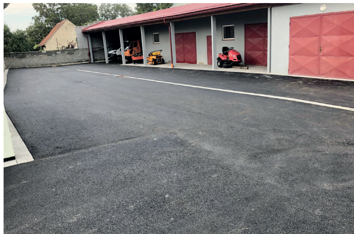
Sběrný dvůr s novým povrchem a odvodněním

Stejně vysokou částku, tedy 1,6 milionu Kč nám poskytne i Ministerstvo životního prostředí na nový rozhlas v rámci projektu Protipovodňová opatření obce Bánov, jehož celková cena bude činit 2,2 milionu Kč. Tyto částky se mohou měnit dle vysoutěžené ceny díla. Realizace proběhne v podzimních měsících.