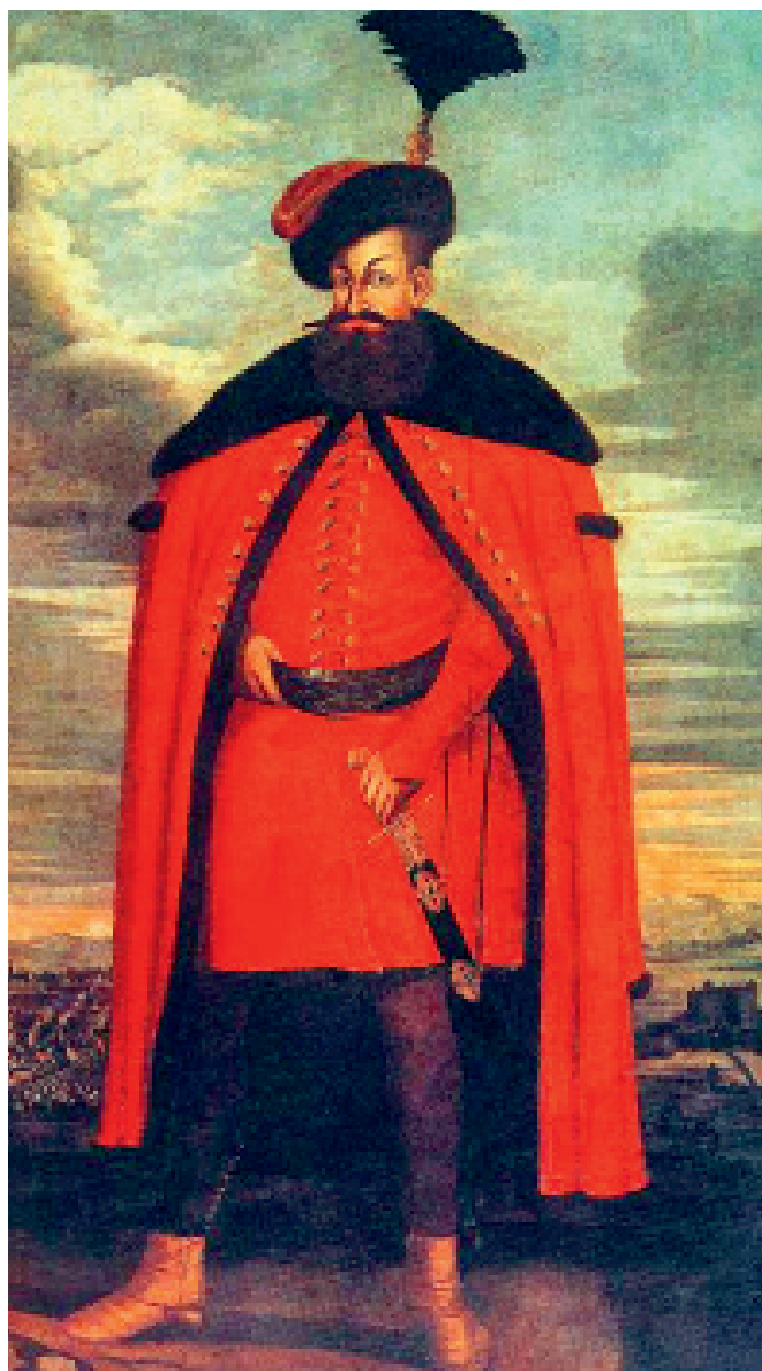
Hrabě Kryštof II. Batthyányi, manžel Marie-Anny rozené Palochay Horváth de Palocsa, (latinsky de Palocian). V letech 1661 až 1687 majitelé Bánovského panství. 28. září 1674 a 18. listopadu 1686 (před prodejem Bánovského panství hraběti Serényimu) provedl soupisy svého bánovského majetku, tzv. urbáře. (Obrázek je přístupný na http://www.batthyany.at/17_jahrhundert.html?&L=0 .)

20. září 1701 zemřel a 22. září byl pohřbený 80 letý „Jacobus Bajzu Pastor“. Možná se jednalo o původního majitele čtvrtlánového domu (který při číslování domů v roce 1770 dostal číslo 5), který je