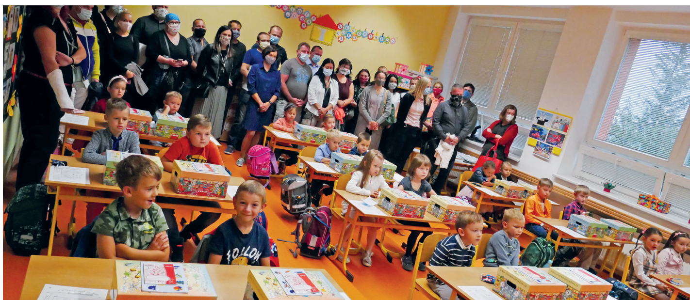
Zahajení školního roku u prvňáčků