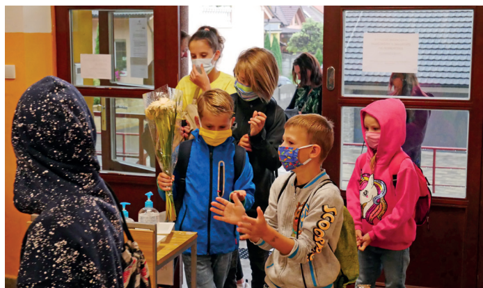
Zahajení školního roku

ročníků 8. 6. 2020. Přesto se jí podařilo bez nejmenších zádrhelů zvládnout. Úspěšně se povedl udělat zápis do 1. třídy a mnoho dalších jednotlivostí.