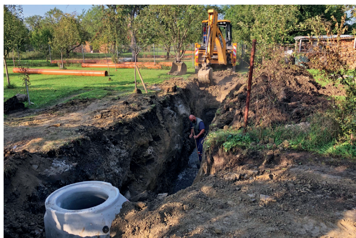
Nova stoka AIO v zahradách na Láně

Z důvodu poškození vypouštěcího mechanismu přehrady Ordějov bude přehrada na podzim vypuštěna a v příštím roce dojde k opravě. Dle projektové dokumentace této opravy bylo v červnu 2019 při provádění potápěčských prací zjištěno, že vnitřní části betonové konstrukce požeráku jsou značně degradované a dochází k vydrolování kusů betonu z konstrukce. Následkem bylo uvíznutí betonových odlomků v uzavíracím mechanismu šoupěte. Následnou manipulací bylo šoupě uzavřeno. Další manipulace šoupětem není možná z důvodu možného dalšího vnosu fragmentů betonu a následné nemožnosti šoupě uzavřít. Odtok z nádrže je v sou-