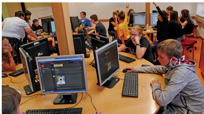
Školení „Jak pracovat v prostředí Microsoft Teams“

Jednoduchá nebyla ani organizace návratu do školy žáků devátých ročníků 11. 5. 2020, žáků prvního stupně 25. 5. 2020 a ostatních