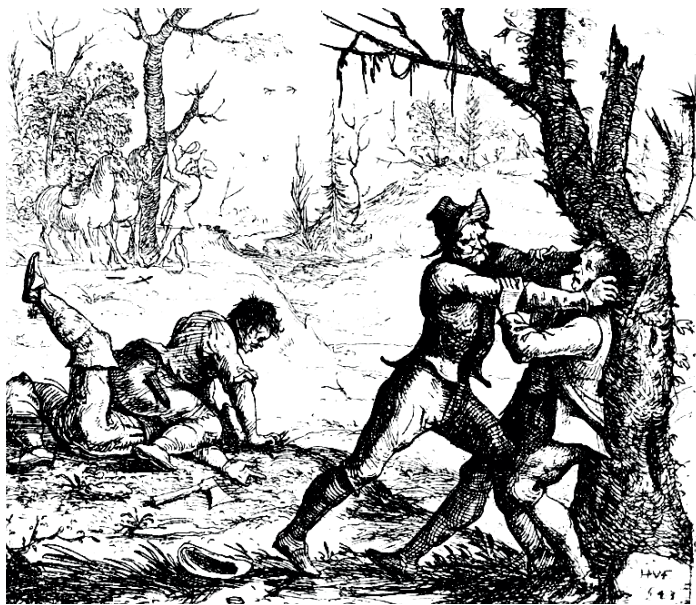
Hans Ulrich Franck – Dravý útok (Dřevoryt po leptání, 1643)