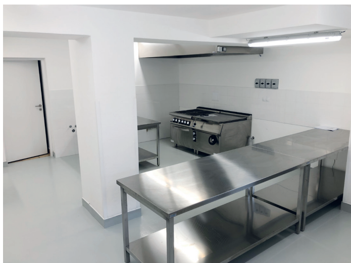
Kuchyně v přízemí pálenice

O viru v tomto čísle asi ještě pár zmínek bude, a tak už se k tomu vracet nebudu, jen si dovoluji vyřknout přání, aby žádná druhá vlna nepřišla a znovu poděkuji všem za kázeň, se kterou ke všemu přistupovali, za nošení roušek, rukavic nebo za dezinfekci rukou. Ještě jednou děkuji všem švadlenkám za šití roušek, všem, kteří nezištně zásobovali své okolí i obecní úřad dezinfekcí a dalšími prostředky. Ještě jednou děkuji za solidaritu a uvědomělost, která nás ochránila před šířením viru v naší obci. Byli i tací, kteří na opatření moc nedbali, ale to ať si každý vypořádá ve svém svědomí.