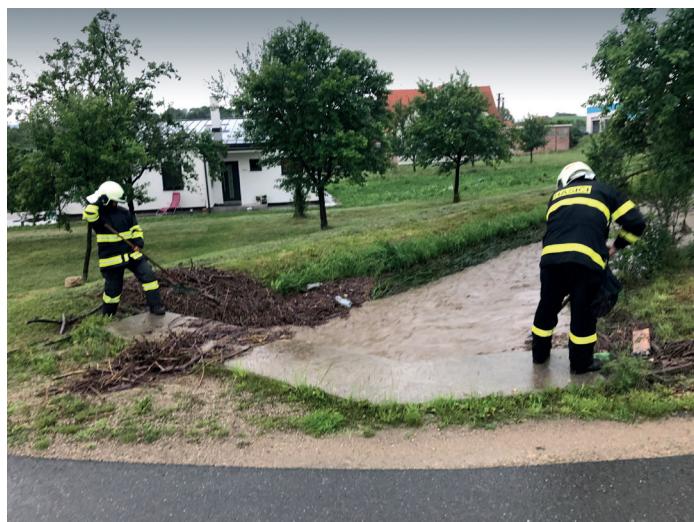
Záplavy - Propustek Jakobovec- směr Díly 13. 6. 2020

V souvislosti s povodněmi se musím vrátit k přivalovému dešti, který v sobotu 13. června zaplavil zahrady dvou domů v Jakobovci. Neprodleně jsme kontaktovali Povodí Moravy, které přislíbilo přípravu projektu vyčištění koryta od sedimentu a náletů v celé části potoka v intravilánu obce. Obecní zaměstnanci vyřezali keře a stromy bránící průtoku a alespoň částečně tak zvýšili průtok v této části potoka.