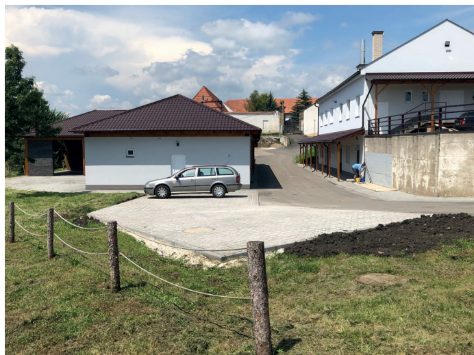
Parkoviště v areálu pálenice

Pokračujeme dál v opravách obecního majetku, a tak přikládám i fotografie z opravené budovy pálenice a zmodernizované velké kuchyně v přízemí budovy. Stavba probíhala od března do června, kdy byla po drobných opravách po reklamaci fasády předána obci k užívání. V současnosti chybí nátěr zdi na pravé straně při vstupu do areálu a na levé straně probíhá dláždění šesti parkovacích míst pro nájemníky pálenice. Věřím, že se nejspíše na Bánovském letě na pálenici všichni potkáme a zhodnotíme, jak se nám dílo povedlo. Tím jsem se dostal k další příjemné zprávě, kterou je to, že se letošní Bánovské leto bude konat, a to v termínu 17. – 19. 7. 2020. Plakát s programem naleznete na zadní straně zpravodaje.