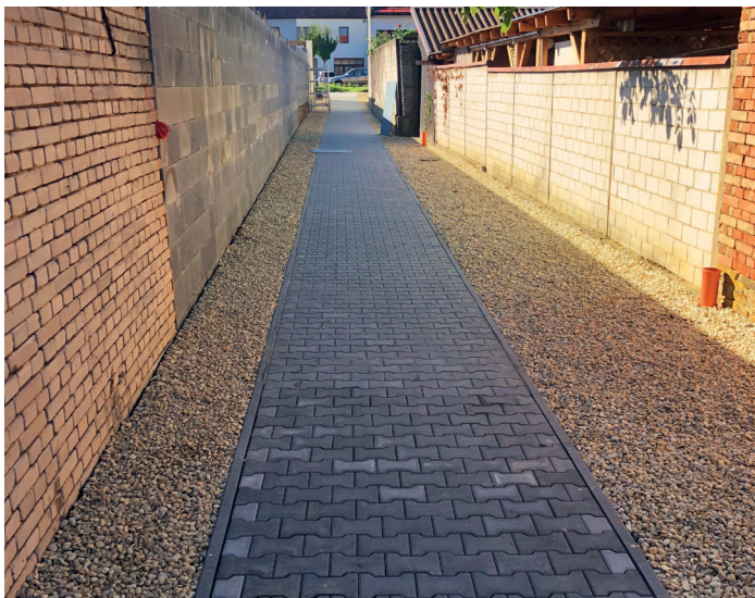
Prodloužení zatrubnění potoka v Hoštákách, chodník a veřejné osvětlení

Letošní daňové příjmy obce byly i díky kompenzaci od státu nižší jen minimálně, a s navýšením investičního rozpočtu o téměř 12 milionů z dotačních titulů se toho letos podařilo vybudovat a opravit hodně: