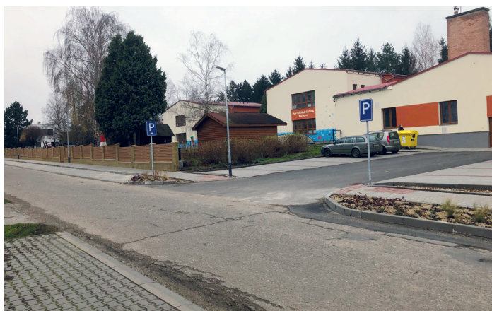
Nové parkovací stání u mateřské školy

Samozřejmě budou probíhat i další potřebné stavební úpravy a opravy v obci, ať už předlažby nevyhovujících částí chodníků nebo např. oprava zatékajících střešních oken na galerii sportovní haly atd. Jak jsem zmiňoval na začátku článku, nemáme jasnou představu, s jakými příjmy na příští rok počítat. Věřím však, že to nebude až tak špatné a při nějaké té úspěšné dotaci se nám bude dařit pokračovat v celkem úspěšném zvelebování naší krásné obce.