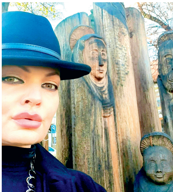
Natáčení v Mekce betlémů a betlémářů v Třebechovicích pod Orebem

z vysoké pozice ve státní správě byla ale velmi cenná, pochopila jsem, jak funguje struktura státem zřizovaných institucí, a těch pod ministerstvem kultury je 27, kromě Národního divadla, Národního muzea a Národní galerie i malé, např. Národní ústav lidové kultury ve Strážnici nebo Muzeum J. A. Komenského v Uherském Brodě. Těm jsem se jako správně děvče z Moravy snažila pomáhat nejvíc, navíc jsem si dala za cíl ministerstvo otevřít veřejnosti a představovat přímo v Nostickém paláci kulturní dědictví jednotlivých regionů. A jsem moc ráda, že se velmi povedla propagace naší části Slovácka. Do Prahy se přijely představit bánovské soubory Kohútek a Zpěvule a měly obrovský úspěch.