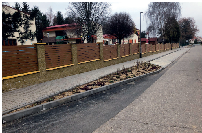
Nové oplocení a chodník u mateřské školy