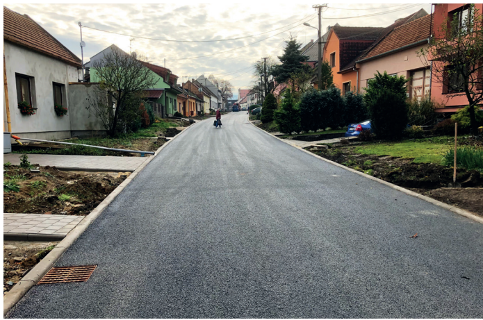
Oprava místní komunikace v Uličce

mi důležité, ať už se podaří vyplnit plán s vybudováním kulturního domu nebo bude prostor prozatím využíván jinak. Během příštího roku začneme připravovat podklady pro architektonickou soutěž na využití tohoto prostoru pro stavbu kulturního domu. Následně by se zpracovala projektová dokumentace a pokud bude vyhlášen vhodný dotační program, připravila by se žádost o dotaci. Jedná se o velkou investici, která bude během na delší trať, ale věřím, že se vše podaří a za pár let bude mít naše obec kulturní prostory vhodné i pro velké oslavy, koncerty, plesy a další kulturní události.