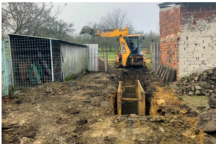
Rekonstrukce stoky A-10