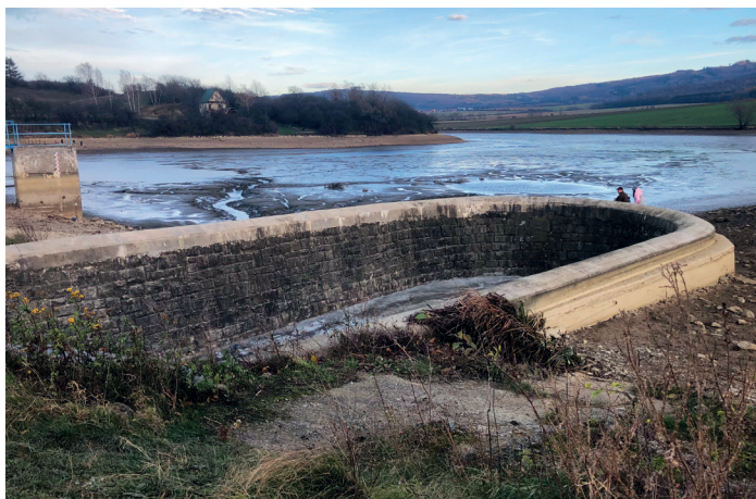
Vypouštění Ordějova k vůli opravě výpusti

V příštím roce plánujeme nový chodník v ulici U Školy, který by prodloužil stávající chodník v nové lokalitě až po základní školu. Současně by se vybudovalo i nové veřejné osvětlení podél chodníku. Podali jsme žádost o dotaci na kompletní rekonstrukci silnice v této ulici, tak zřejmě do května budeme čekat, jestli uspějeme. Mezitím by si měli obyvatelé této ulice promyslet, jestli si nebudou rozšiřovat parkovací stání, aby tomu mohl být chodník přizpůsobený. V současnosti je zde silnice tak široká, že odstavené auto není až takový problém, pokud ovšem někdo nepostaví auto i na protější stranu. To je pak problém projet a normálnímu řidiči zůstává rozum stát, jak může někdo s řidičským oprávněním takto parkovat. Chtěl bych opět upozornit, tak jako každoročně a v mnohých případech zbytečně, že parkování aut na silnici není v pořádku. Každého projíždějícího řidiče to omezuje, a to, že někdo nechce stát na svém vjezdu a je mu pohodlnější zabrat půlku silnice, to je nejen neohleduplné, ale i nezákonné. Proto není divu, že si na to řidiči stěžují a obecní úřad jako správce místních komunikací, který nemá pravomoc nikoho pokutovat, musí žádat o řešení policii. I nám je to