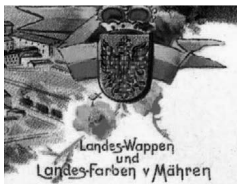
Zemské barvy a znak Moravy, 1900