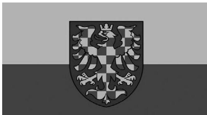
Současná podoba moravské vlajky