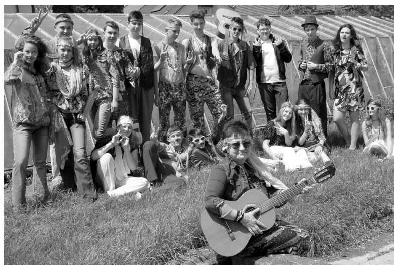
Devátáci při školním focení v květnu 2016.