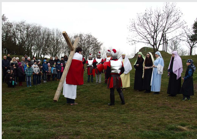
Křížová cesta 25. března 2016 na Skalu