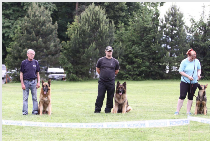
Dětský den 4. června 2016 na Skaličkách pořádaný Kynologickým klubem a Obecním úřadem Bánov