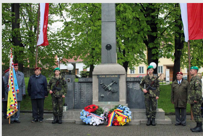
Dne 27. dubna se uskutečnil pietní akt k 71. výročí osvobození Bánova rumunskou armádou