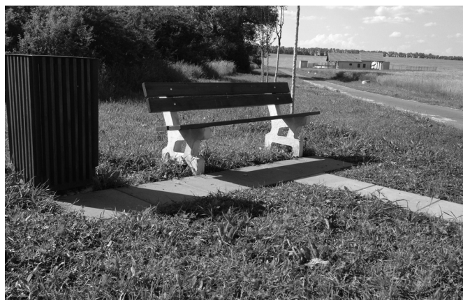
Odpočinkový bod u čistírny odpadních vod