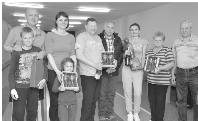
Společné foto vítězů