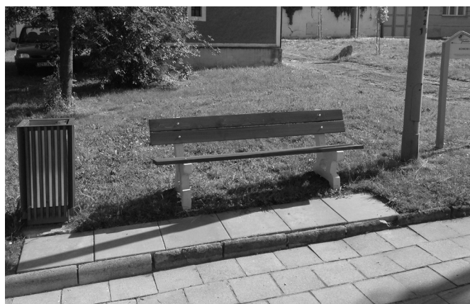
Nově vybudovaný odpočinkový bod u komory