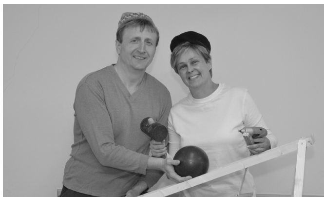
Pat a Mat