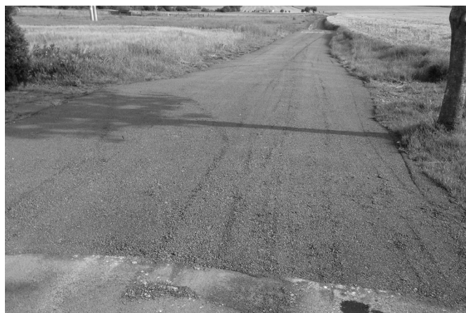
Zpevněná polní cesta na Močiči