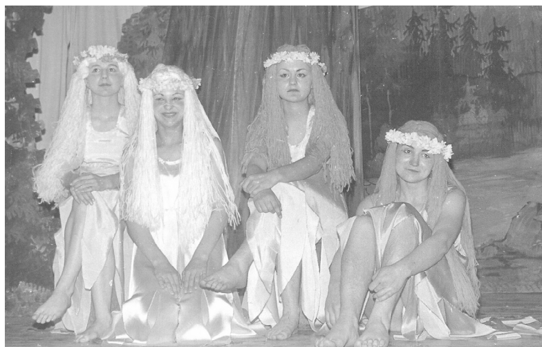
Lucerna - 1984