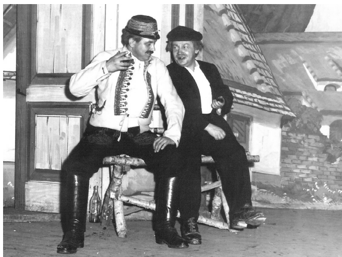
Naši furianti - 1966