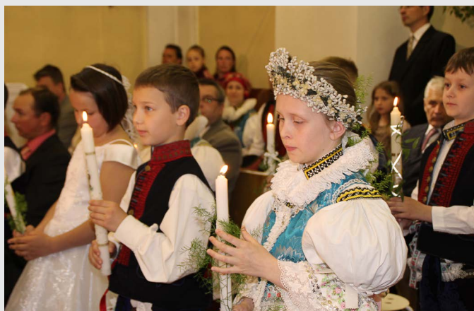
První svaté přijímání 22. května 2016