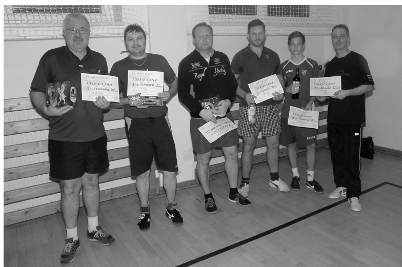
Vítězové čtyřher turnaje ve stolním tenise

Bazárek probíhá tak, že maminky přinesou oceněné oblečení opatřené iniciálami a seznam věcí. My si je pro lepší přehled označíme a roztrídíme do věkových kategorií. Vše je rozloženo na stolech nebo zavěšeno na věšácích. Příchozí si tak mohou projít celou místnost v klidu, porozhlédnout se a navybírat krásné kousky.