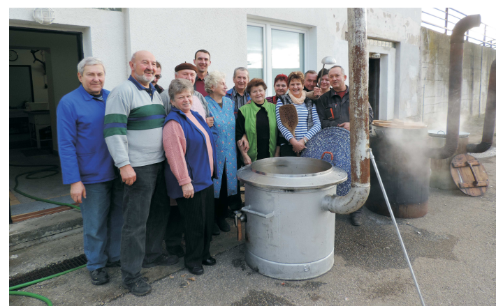
Obecní zabijačka pod vedením zkušeného zabijačkového týmu.