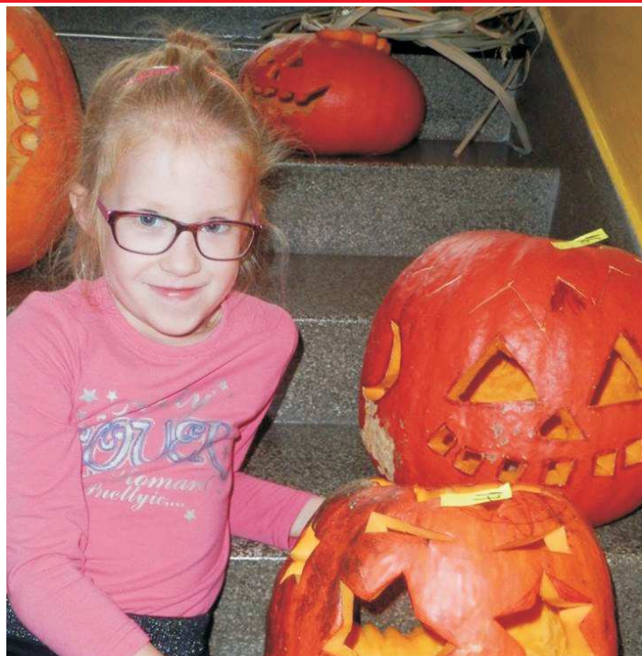
Dýňová slavnost - Tento rok byla slavnost doprovázena nádherným počasím, děti byly v maskách a stezka odvahy byla opravdu pro odvážné-vedla školní zahradou.