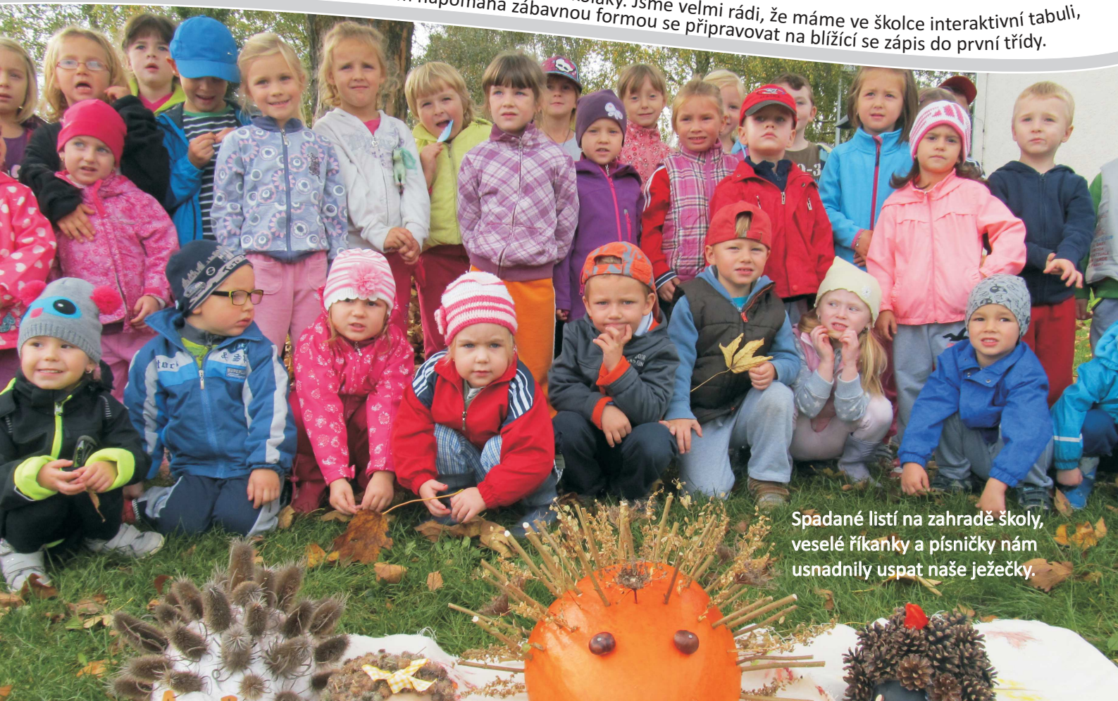
Spadané listí na zahradě školy, veselé říkanky a písničky nám usnadnily uspat naše ježečky.

Hola, hola, škola volá na naše předškoláky. Jsme velmi rádi, že máme ve školce interaktivní tabuli, která nám napomáhá zábavnou formou se připravovat na blížící se zápis do první třídy.