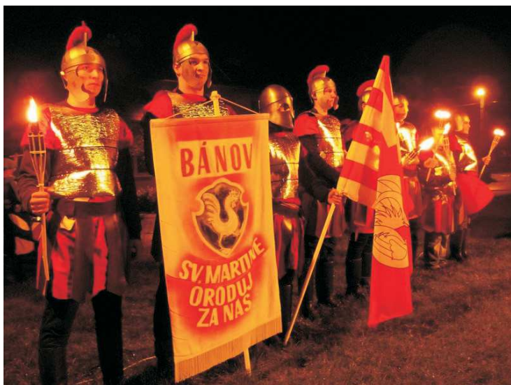
Hody - Pátek odstartoval kapelou Street 69, v sobotu proběhla slavnostní mše a průvod zakončený pohádkou o Sv. Martinovi, večer hodový cimbál s CM Rozmarýn.