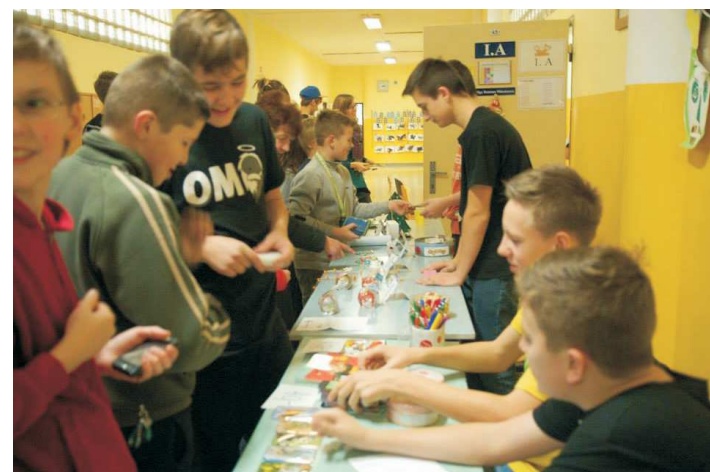
Vánoční dílna , kterou připravili žáci základní školy.