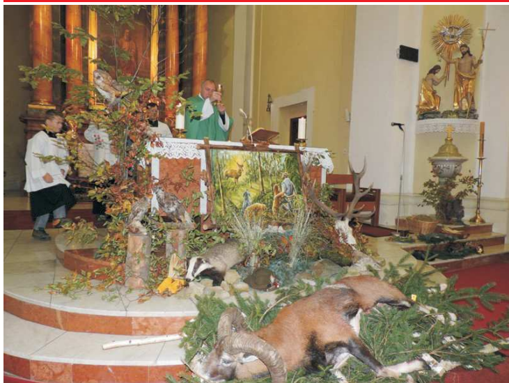
Svatohubertská mše v chrámu sv. Martina v Bánově. Slavnostní troubení přerovských trubačů při slavnostní bohoslužbě za živé i zemřelé myslivce.