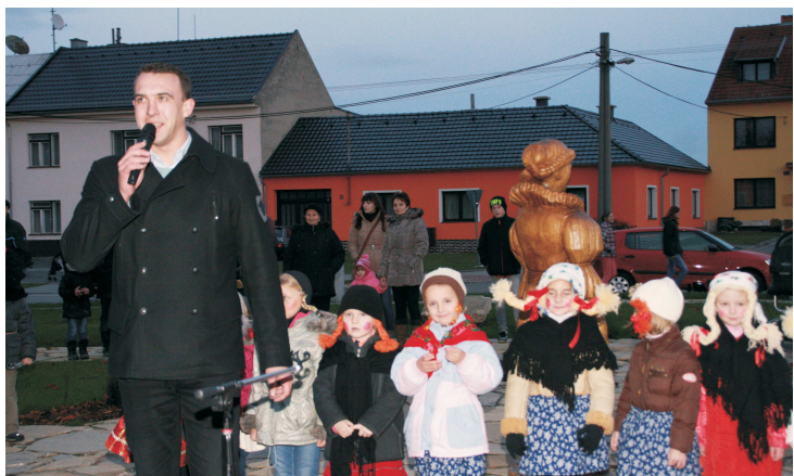
Rozsvícení vánočního stromu zpříjemnilo vystoupení dětí z mateřské školy s pásmem Čert a Káča.