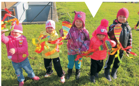
Činnost školy se prolíná s děním v naší obci. I tentokrát k nám přijel sv. Martin na bílém koni.