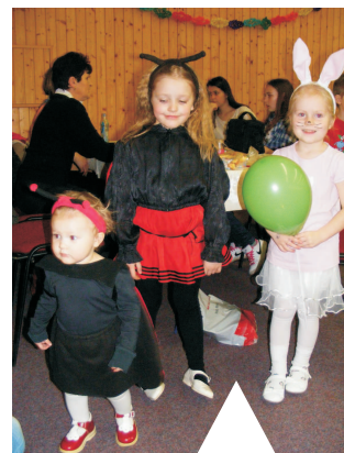
Pro nejmenší se pořádají Dětské šibřinky neboli karneval. Pro děti byly připraveny hry a diskotéka.