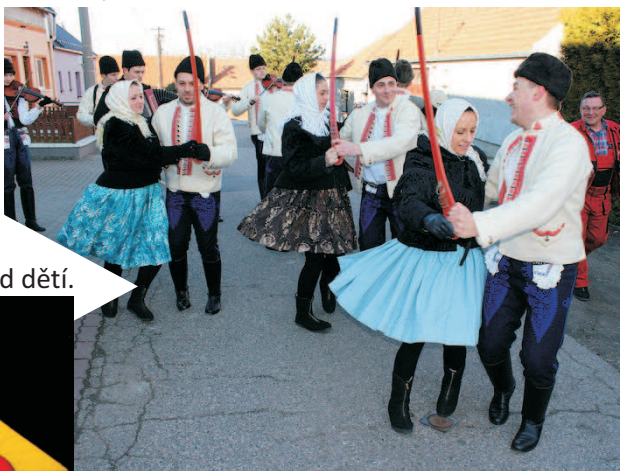
Tradiční fašankovou obchůzku mají na starosti folklórní soubor Kohútek a cimbálová muzika Strúček. Přidali se i dobrovolníci v maskách z řad dětí.