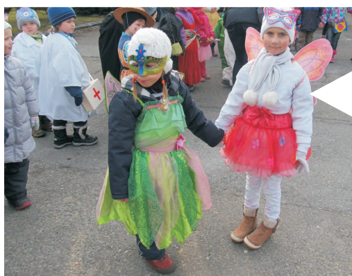
Fašankovou veselici začala letos mateřská škola. Děti v maskách prošly obcí, zazpívaly a zatancovaly.