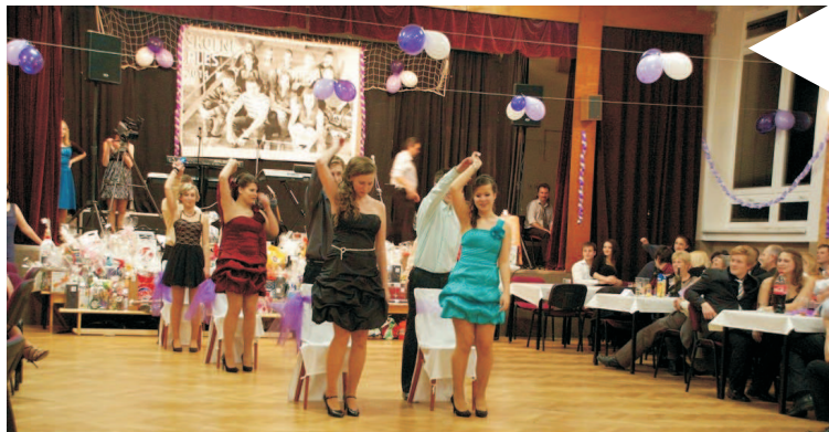
Začátek roku je ve znamení plesů – ten školní je známý zejména předtančením žáků devátých tříd.