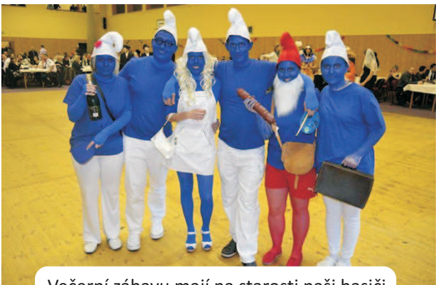
Večerní zábavu mají na starosti naši hasiči, koná se v maskách na sportovní hale. Letos byli jedněmi z oceněných Šmoulové.