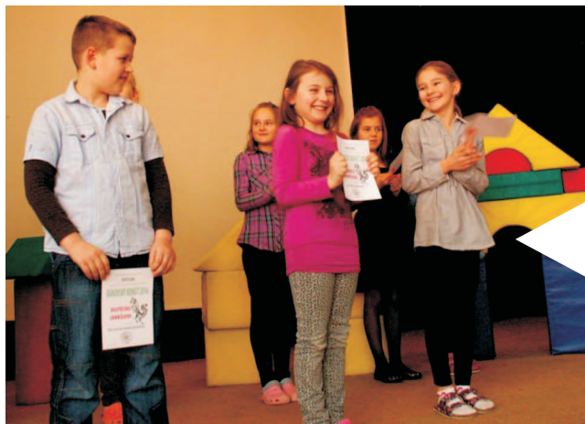
Základní škola uspořádala v sále soutěž malých zpěváčků s názvem Bánovský kohút, v níž byli vybráni šikovní zpěváci do dalších kol v Uherském Brodě.