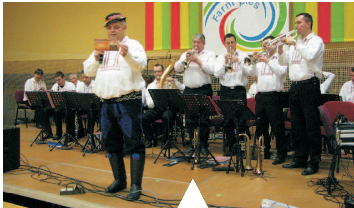
Myslivecký a farní ples si užili nejen milovníci dechové hudby. Na farním plese došlo mimo jiné k dražbě jedné z cen.