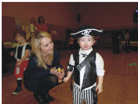
Na dětských šibřinkách jsme mohli potkat krásné princezny i strachnahánějící piráty.