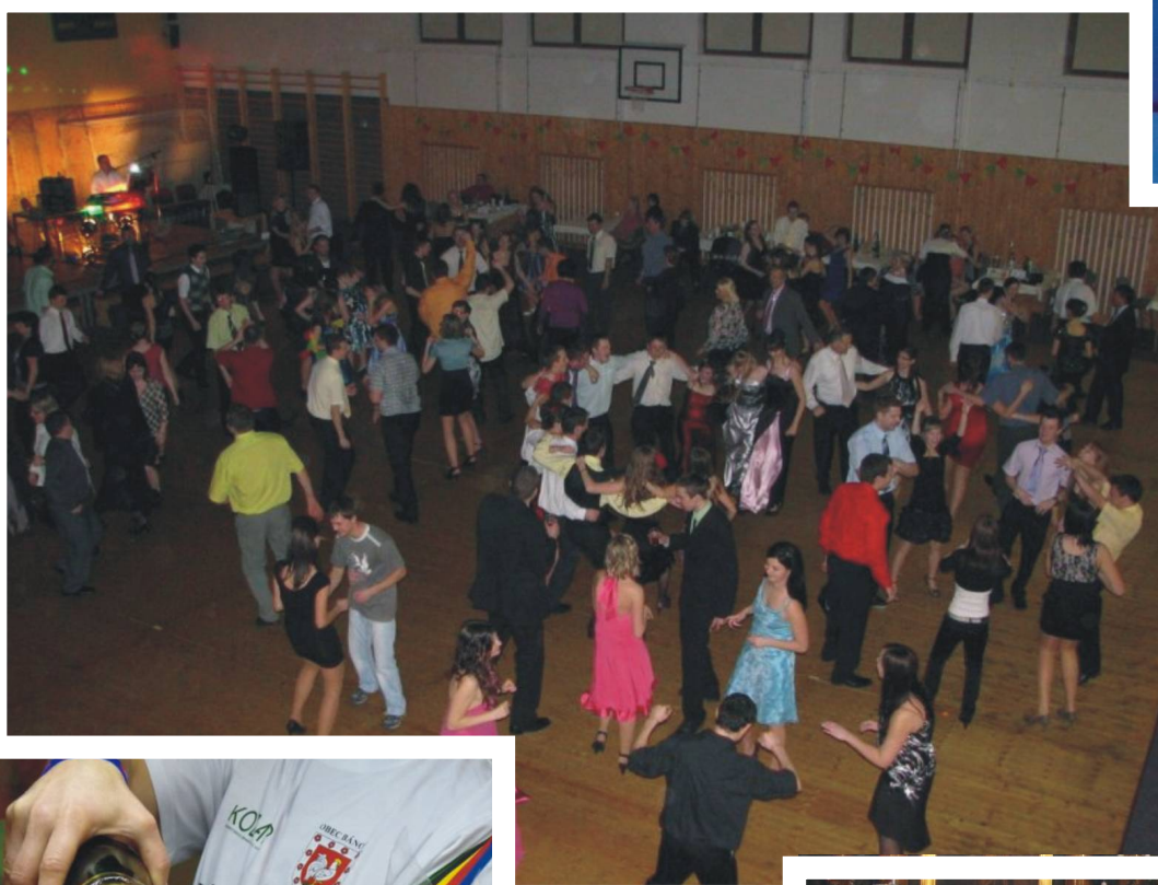
Společně se zabavit, zatančit si a sejít se s přáteli jsme měli možnost během celé letošní plesové sezony ve Sportovní hale.