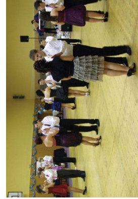
Předtančení deváctáků na školním plese 14. 1. 2012.