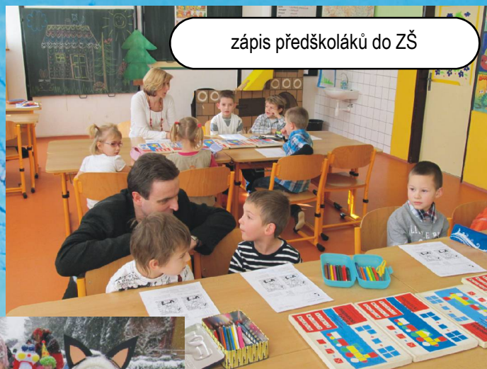
zápis předškoláků do ZŠ