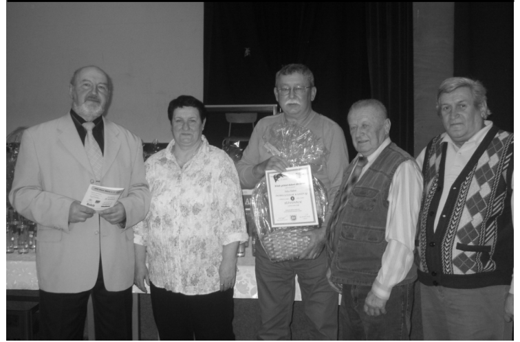
Vítězové III. ročníku Koštu slivovice v Bánově

Kubiše. Poděkování patří všem našim sponzorům, příznivcům, kteří do soutěže svou slivovici poskytli, a v neposlední řadě i všem členům Klubu seniorů, kteří přiložili ruku k dílu a tuto náročnou akci připravili.