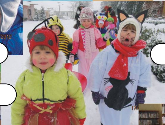
fašanková obchůzka po Bánově