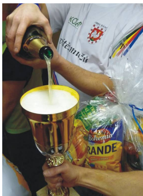
Ve Sportovní hale proběhl již devátý ročník Obecního turnaje v kuželkách. U žen prvenství obhájily Házenkářky, u mužů vyhrál již potřetí Sokol kopaná A.