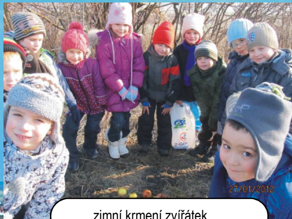
zimní krmení zvířátek

USKUTEČNĚNÉ AKCE V MŠ: školní rok 2011/2012