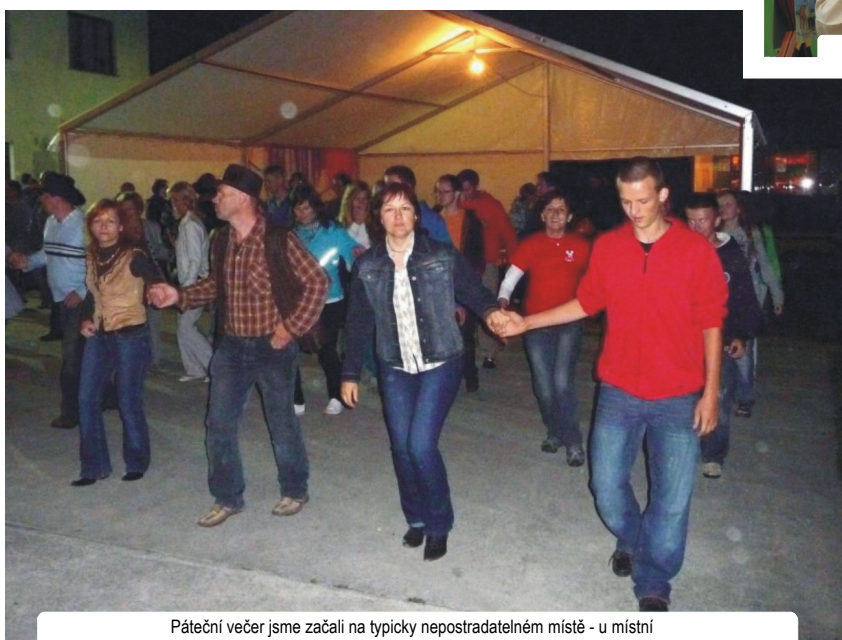
Páteční večer jsme začali na typicky nepostradatelném místě - u místní pálenice - country bálem a taneční parket rozhodně nebyl prázdný