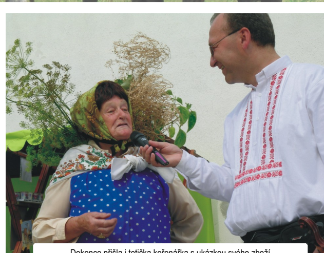
Dokonce přišla i tetička kořenářka s ukázkou svého zboží