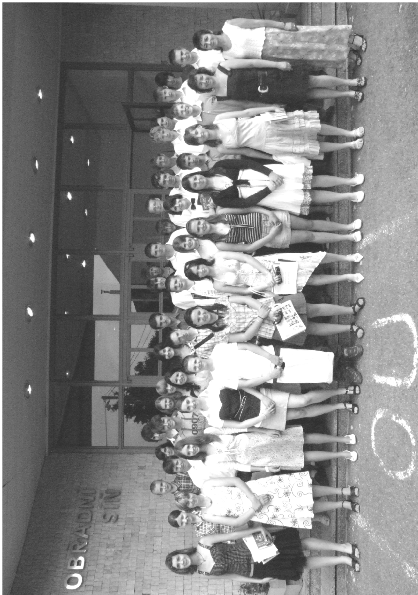
Letošní absolventi 9. tříd Základní školy Josefa Bublíka v Bánově. Redakce BZ přeje hodně zdaru v dalším studiu a správnou volbu povolání.