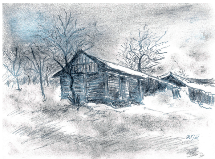
Stodola na Maršově ve vánici a pod sněhem, tužka a bílá tempera na papíře, rok 2006