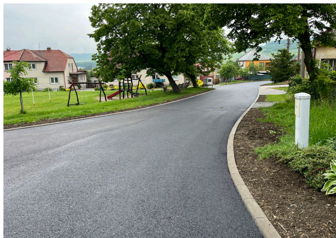
Silnice u Jarmeku

V těchto dnech se blíží do finále i výstavba nového a rekonstrukce starého chodníku v ulici naproti sportovní haly. Při rekonstrukci jsme provedli i nový rozvod a výměnu sloupů veřejného osvětlení. Trochu se změnilo rozmístění sloupů a snížil jejich počet, aby celá ulice měla stožáry ve stejných vzdálenostech, což je umožněno jinou optikou svítidel a výškou sloupů.