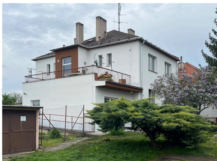
Fasáda Junášкова vila (po rekonstrukci)