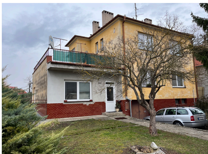
Fasáda Junášкова vila (před rekonstrukcí)

V jarních měsících byla také opravena fasáda na Junáškově vile, vydlážděno stání na kontejnery u mateřské školky, opravena podlaha v pálenici (tam, kde se opravdu pálí), u vodní nádrže na Šumáku jsme zhotovili nové posezení kolem ohniště, a ještě máme připraveno dřevo na stavbu malého mola. Jsem rád, že je vodní nádrž výletním centrem pro děti i dospělé. Všechny prosím, aby zde udržovali pořádek a čistotu. Voda stále moc na koupání nevypadá, ale zato si místo oblíbily kachny, labuť a dař se tu i rybám. Jelikož není umožněno po dobu udržitelnosti projektu provádět intenzivní chov ryb, a tedy ani rybaření s výdejem povolenek, umožňujeme tu rybaření pouze dětem, aby se pobavily. Samozřejmě s dětmi mohou přijít i rodiče, ale dospělým rybařům zde rybolov umožněn není. →