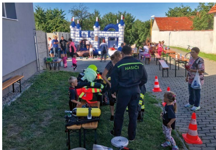
Den otevřených dveří v hasičské zbrojnici ke 125. výročí založení hasičského sboru v Bánově

Další prázdninovou stavbou je oprava kanalizace v Uličce, která právě probíhá v režii Slováckých vodáren a bude pokračovat napojením protějších domů na novou stoku a zasypaním staré kanalizace. To už je investicí obce. Realizační firma ale zůstává stejná. Na jaro se v Uličce bude rekonstruovat i vodovod a v prázdninových měsících 2020 by měla přijít na řadu nová vozovka.