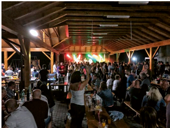
Prague Queen na Bánovském letě

Ještě se trochu vrátím v čase k Bánovskému letu. Letos poprvé pod novým zastřešením na pálenici, které zde bylo slavnostně otevřeno. Ještě v červenci se stavěla nová příjezdová komunikace a dláždil chodník podél budovy pálenice, ale vše se stihlo bez větší