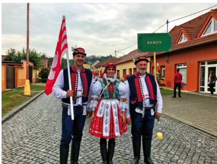
Slavnosti vína Uherském Hradišti

Září patří tradičně i slavnostem vína, kterých se účastní padesátka krojovaných Bánovjanů. I letos jsme vyrazili v silné sestavě a Kohútek, Hútek i Zpěvule prošli průvodem a vystoupili také na podiu Mariánského náměstí. Naše výprava měla celkem štěstí, že začalo hustě pršet, až když jsme prošli náměstím a dokončili průvod. Mikroregiony, které šly za námi, takové štěstí neměly a bohužel zmokly více. Přes uplakané počasí byla nálada dobrá a ani na množství hostů to velký vliv nemělo. Věřím, že nás teď čeká zase pár slunečných ročníků.