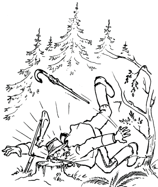
Ilustrace z knihy Slovácko sa súdí.

P.S. editor ňa može polúbit tam, kam sa normálne nelúbe