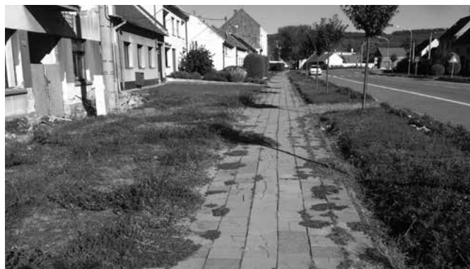
Hoštáky - chodník, původní stav