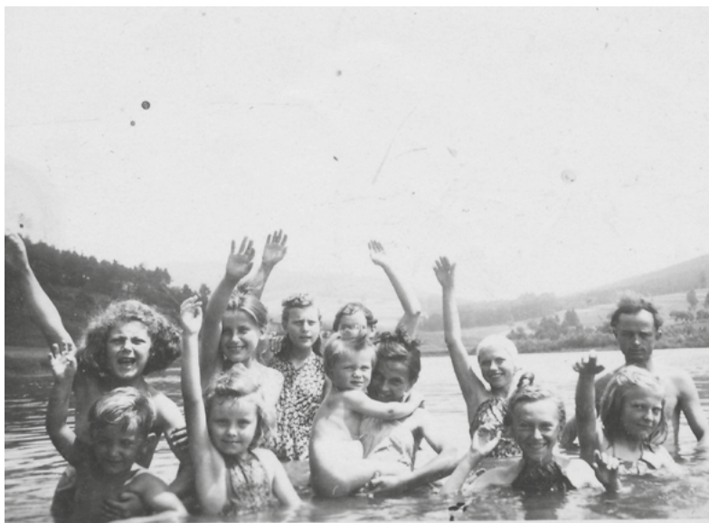
3. srpna 1946 – koupání v Luhačovické přehradě