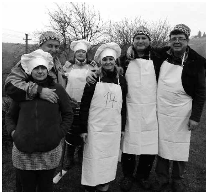
Reprezentanti ve vaření guláše na Lopeníku, obsadili 4. místo