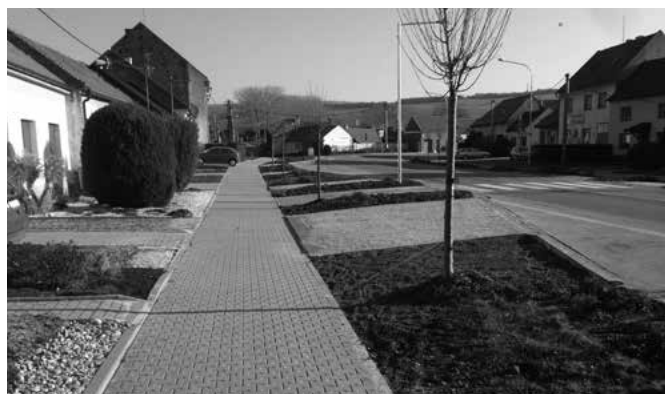
Hoštáky - chodník po rekonstrukci