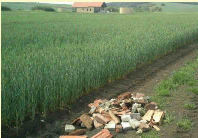
Černá skládka nedaleko ČOV