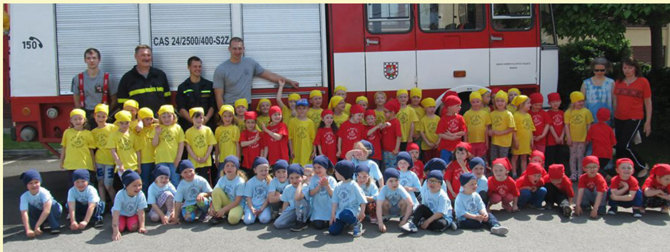
Dětský den Mateřské školy s hasiči