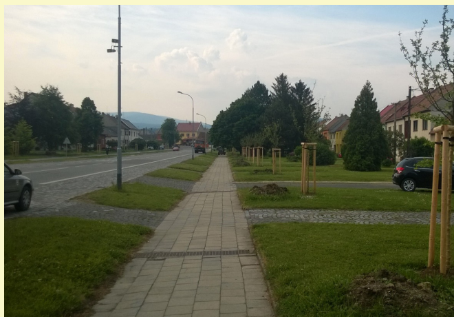
Nová výsadba v Hlavní ulici