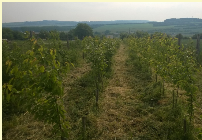
Větrolam nad plynárnou