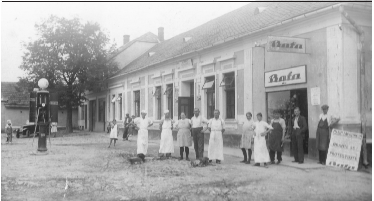
Vzpomínka na prvorepublikový Bánov, obchod s obuví Baťa, hospodu u Mandíků a první benzínovou pumpu, která stála před hospodou.