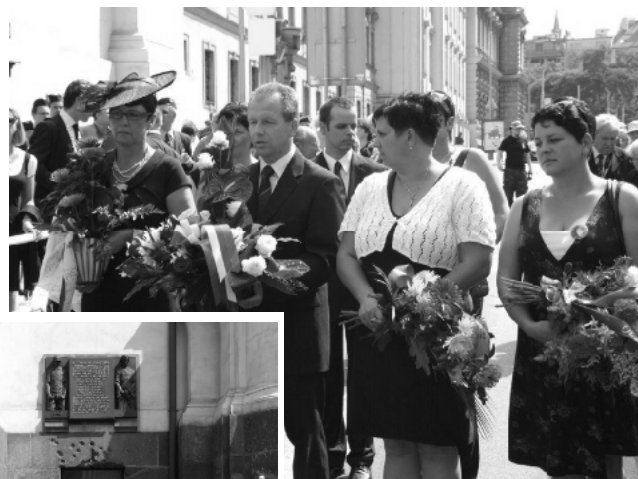
Starostové rodných obcí hrdinů z Resslervy ulice. Z Kunovic, Bánova, Rešic a Dolních Vilémovic.