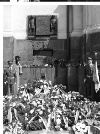
18. červen 2012 - věnce pod pomníkem hrdinů u kostela sv. Cyrila a Metoděje v Praze

Další fotografie najdete na www.banov.cz