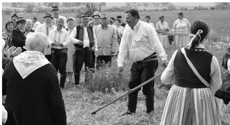
Kosení na Východním Slovácku, Suchá Loz, 17. 5. 2015