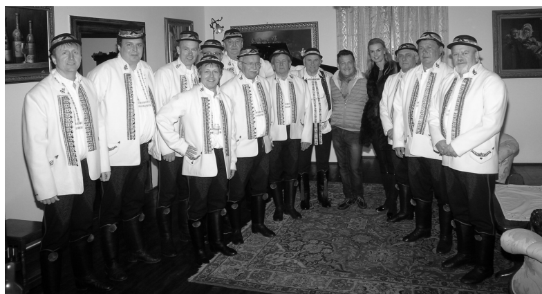
Velikonoční jarmark na zámku v Ořechově, 29. 3. 2015