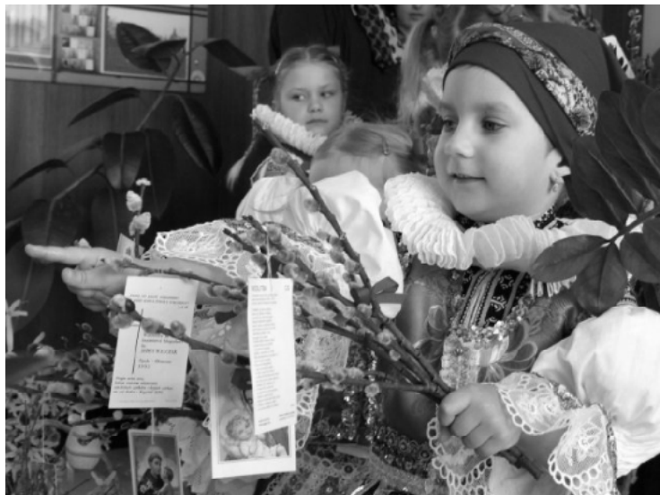
Foto: Letařka v kroji s kočičkami a svatýma obrázkama