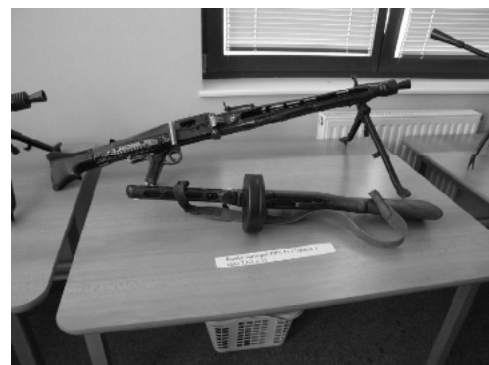
Foto: Z výstavy Bánov za II. světové války