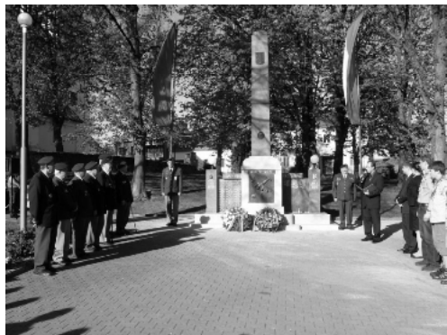
Foto: 27.duben 1945 připomínka osvobození Bánova rumunskými vojáky