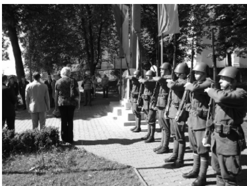
Pietní vzpomínka na hrdiny z Resslervy ulice v Bánově